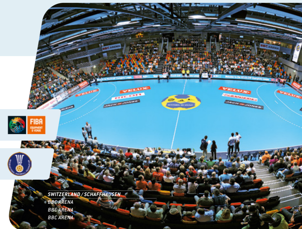
SWITZERLAND / SCHAFFHAUSEN BBC ARENA BBC ARENA BBC ARENA