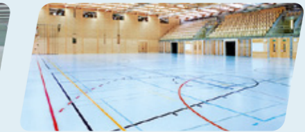
SWITZERLAND / TEUFEN SPORHALLE LANDHAUS LANDHAUS SPORTS HALL SALLE OMNISPORT DE LANDHAUS