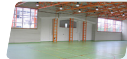
ROMANIA / BISTRITA NASAUD LICEUL SPORTIV, SPORHALLE LICEUL SPORTIV, SPORTS HALL LICEUL SPORTIV, SALLE DE SPORT