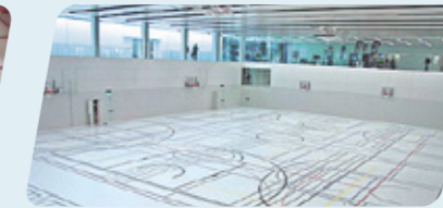
SWITZERLAND / ZURICH ETH, SPORHALLE ETH, SPORTS HALL ETH, SALLE DE SPORT